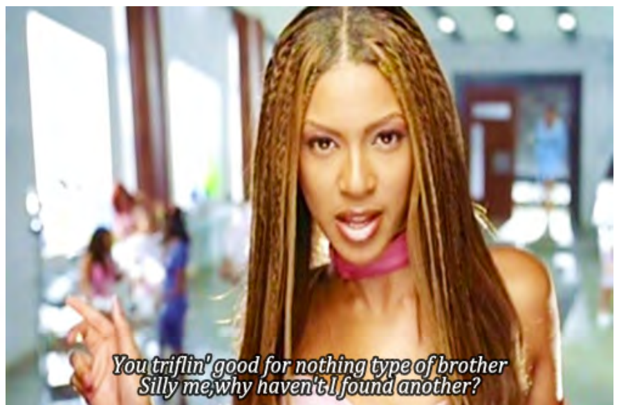
Marcia Kure, Ethnographica IV , 2014 & Destiny's Child, Bills bills bills , 1999.