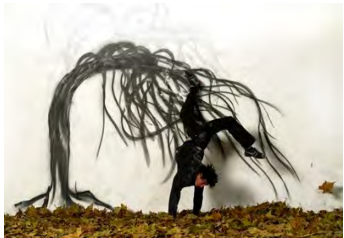
Pascal Duthoit, Sans titre , 1987 & Robin Rhode, The Storyteller , 2006.